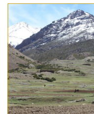
Le plateau d'Ikkis, Le M'goun.