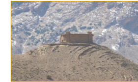
La colline de Sidi Moussa